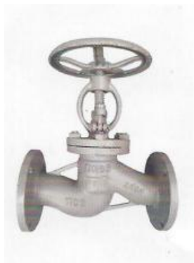
КЛАПАН ЗАПОРНЫЙ (ВЕНТИЛЬ) ФЛАНЦЕВЫЙ (15С65НЖ) РУ 1,6 МРА (16КГС/СМ2)