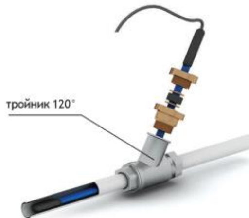
Рис. 4 - Схема ввода нагревательной секции внутрь трубопровода под углом 120°