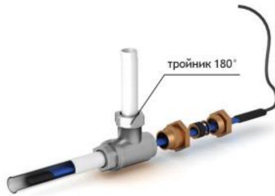
Рис. 2 - Схема прямого ввода нагревательной секции внутрь трубопровода