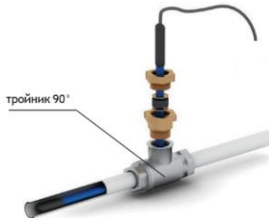
Рис. 3 - Схема ввода нагревательной секции внутрь трубопровода под углом 90°