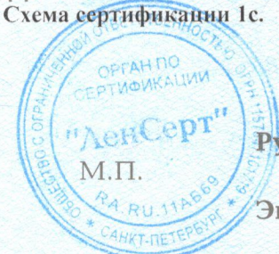
Схема сертификации Ic.